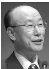
David Yonggi Cho

No existe nada más peligroso que los virus, no solamente aquellos que afectan la salud física del individuo, o el sano funcionamiento de una computadora, sino también aquellos que tienen que ver con la vida religiosa. Desde tiempos antiguos el sectarismo religioso ha sido un mal que el mundo ha sufrido, por lo que millones de personas se perderán en el infierno a causa de ese mal. Sin embargo, en los últimos tiempos la mentira, el engaño del sectarismo ha estado sufriendo mutaciones, cambios que el fenómeno secta religiosa ha ido fraguando a través de los años, en su afán de establecer mega iglesias, evangelismo agresivo, especialmente con un evangelio y organización apartados de la verdad. Y es ahora cuando diversas sectas religiosas se están viendo afectadas por esta nueva corriente de doctrinas sectarias, amenazando con tumbar sus ya arcaicos sistemas sectarios, con el establecimiento de modernas organizaciones y doctrinas falsas.