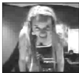
Fotos de sus conciertos

Ella afirma que la intención principal en su obra es hacer jóvenes diferentes, pero preguntamos, ¿diferentes a qué? Compare usted sus conciertos, su música, sus bailes, aún su forma de vestir y notará que de diferencia con lo que el mundo produce no es mucha.