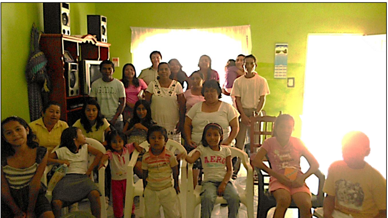
Iglesia de Cristo en Chihuahua, Oaxaca